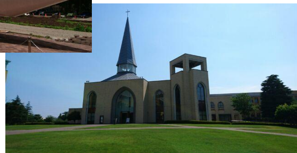
青山学院大学 相模原キャンパス