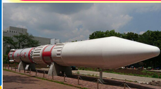
JAXA 相模原キャンパス